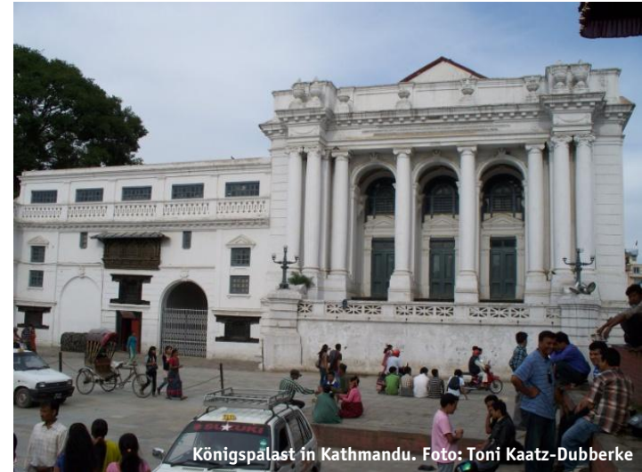
Königspalast in Kathmandu.

Ein vom Militär unterstützter Putsch im Februar 2005 machte Gyanendra zum absoluten Monarchen. Indien, Großbritannien und die USA stellten daraufhin ihre Unterstützung gegen die Maoisten ein. Zudem öffnete dieser Staatstreich den Raum für Verhandlungen der entmachteten demokratischen Parteien mit den Maoisten. Gemeinsam organisierten die in einer Allianz zusammen geschlossenen Parteien ( Seven Party Alliance ) im April 2006 friedliche Massendemonstrationen und einen 19tägigen Generalstreik , der den König zum Rücktritt zwang.