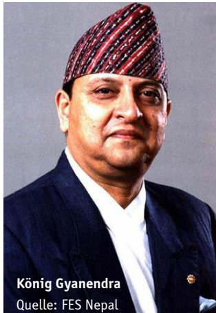
König Gyanendra

Von 1996 bis 2001 bekämpfte die vom konservativen Nepali Congress (NC) geführte Regierung die maoistischen Rebellen mithilfe der schlecht ausgerüsteten Polizei. König Birendra (1972-2001) lehnte den von der Regierung geforderten Einsatz der Armee ab. Sein Nachfolger Gyanendra rief jedoch im November 2001 den Notstand aus und mobilisierte die Armee. In diesem Kampf gegen die maoistischen „Terroristen“ wurde er politisch und materiell von Indien, Großbritannien und den USA unterstützt. Die durch den Einsatz der Armee steigende Zahl an Opfern führte zur einer weiteren Entfremdung der Bevölkerung gegenüber Staat und König und stärkte die Maoisten.